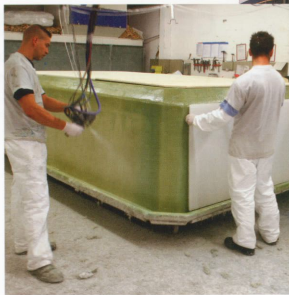
Grote interesse voor opleiding tot composietverwerker in Noord-Nederland

Naast de scholing tot composietverwerker en het branche-erkende diploma, krijgen de deelnemers ook een stage van twee maanden en een dienstverband voor bepaalde tijd. Momenteel zijn er twaalf arbeidsplaatsen bij Friese composietverwerkende bedrijven. Auriga Arbeidsbemiddeling doet een voorselectie op de aangemelde deelnemers zodat de aangemelde bedrijven een passende kandidaat krijgen. Vervolgens worden bij aanname de deelnemers door VAPRO opgeleid tot composietverwerker niveau I.