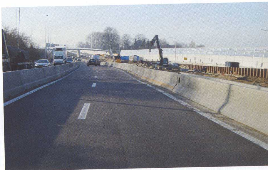
Ophoogwerkzaamheden aan de A15 in januari 2005.

aan potentiële opdrachtgevers duidelijk te maken. De consequentie is de haast automatische voorkeur voor de traditionele bouwwijzen.