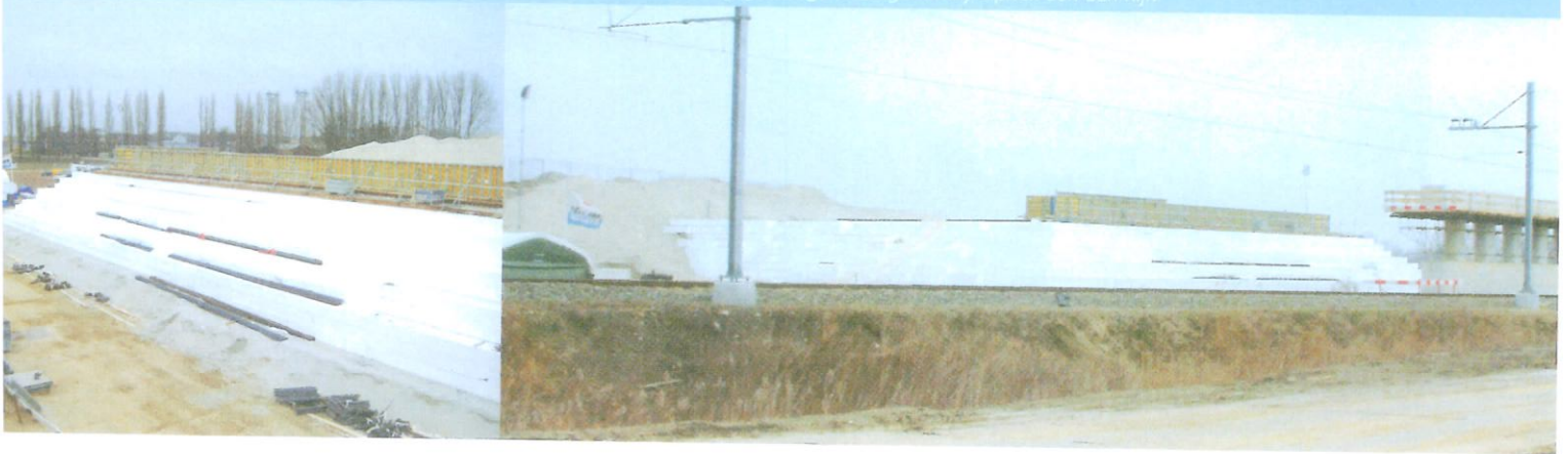
Aanleg lichtgewicht landhoofden voor de kruising over het spoor op de zettingsgevoelige ondergrond bij Alphen aan den Rijn

is EPS op tal van projecten met succes gebruikt. Vooral in veengebieden, waar bij de drijvende weg het meest tot de verbeelding spreekt. Daarom mag het gebruik van Geoblock tot de categorie van bewezen technieken worden gerekend.