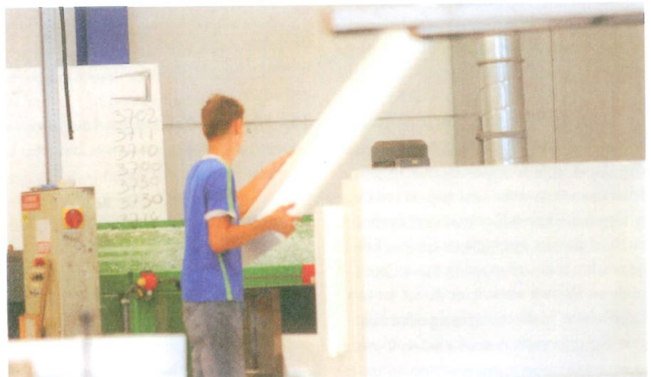
Bewerking bij productie EPS

korte termijn uitbreiden van 2 x 2 naar 2 x 3 rijstroken. Voorbelasten met zand duurt al snel twee à drie jaar bij gebruik van drainagesystemen. Deze tijd kan gewonnen worden met lichtgewicht