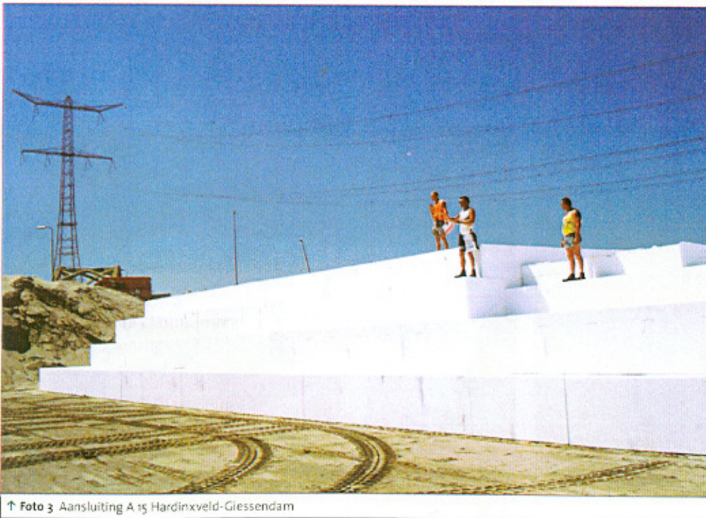
↑ Foto 3 Aansluiting A 15 Hardinxveld-Giessendam