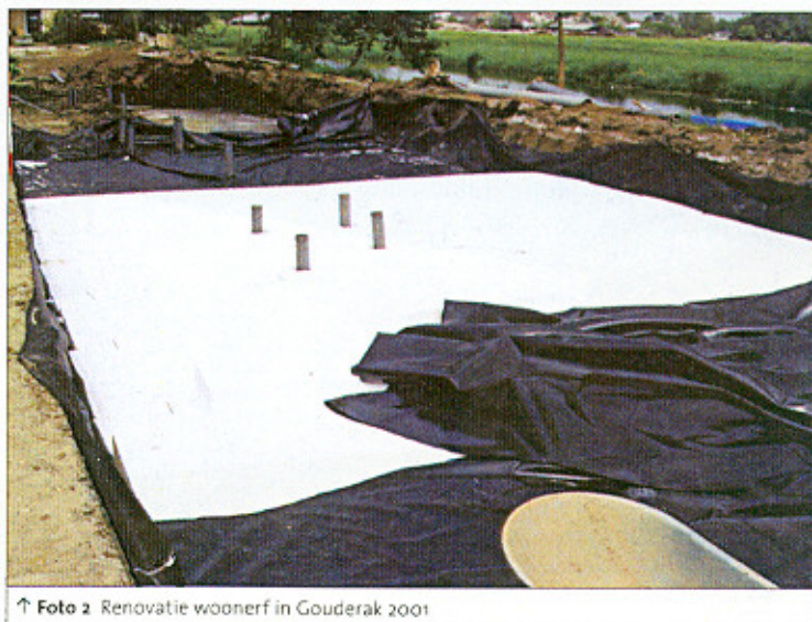
↑ Foto 2 Renovatie woonerf in Gouderak 2001