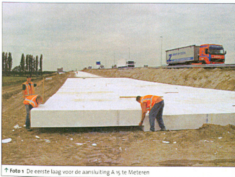
↑ Foto 1 De eerste laag voor de aansluiting A15 te Meteren

norm voor EPS als isolatie opgezet. Binnen CEN-TC 127 ("Road Materials") en de Europese EPS-industrie werd halverwege de jaren '90 al de behoefte gevoeld tot een aparte geharmoniseerde norm voor EPS als "light weight fill in civil engineering applications" te komen. Omdat de deskundigheid bij de isolatiesector lag, mocht de auteur van dit artikel vanuit CEN TC 88 die 'kar trekken'. Deze zomer volgt de