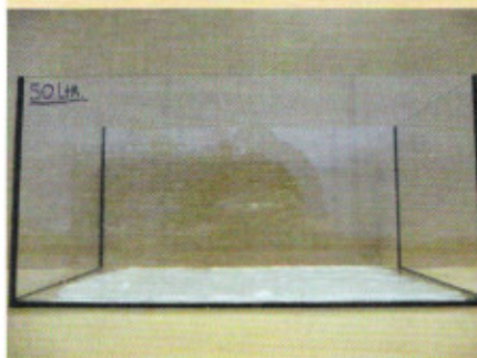
Uiteindelijk resteert een laagje pasta en daarboven herbruikbare compacteervloeistof