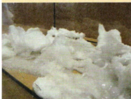
Het EPS verschrompelt na besproeiing met compacteervloeistof