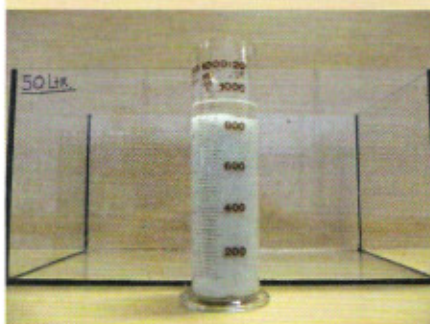
De overgebleven 0,86 liter pasta in een maatglas

moleculaire keten. Onze machines kunnen EPS verwerken, maar EPP niet", licht De Wijs toe. Goede voorlichting zou vervuiling deels kunnen ondervangen, maar handmatige sortering van het materiaal lijkt vooralsnog onontkoombaar.